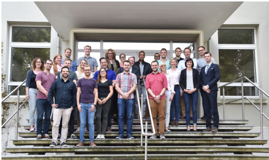
Erstmals wird der Masterstudiengang der FHÖV NRW auch in Köln angeboten.

Jahrgangs werden zusätzliche Lehrende diesen Kreis erweitern können.